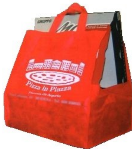
MODELLO PORTA PIZZA